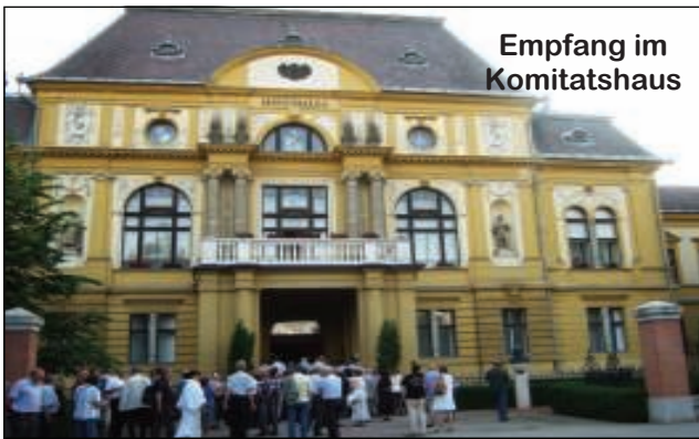
Empfang im Komitatshaus